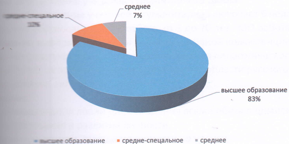
Качественный состав учителей